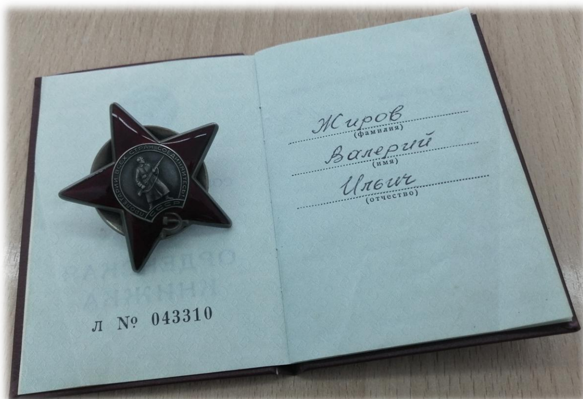
За отвагу и мужество посмертно награжден Орденом Красной звезды